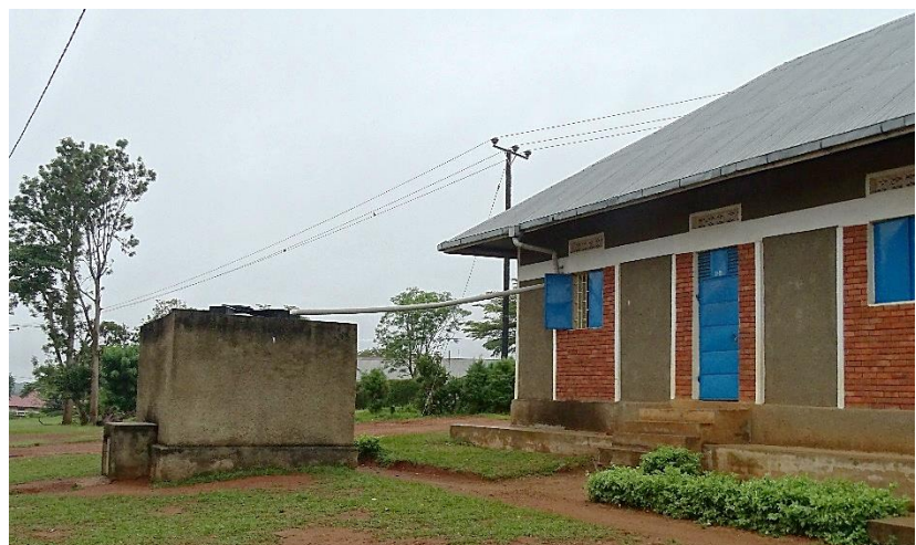
Hiernaast een van de 2 bovengrondse watertanks

Een nieuwe ondergrondse tank gaat dit probleem hopelijk oplossen.