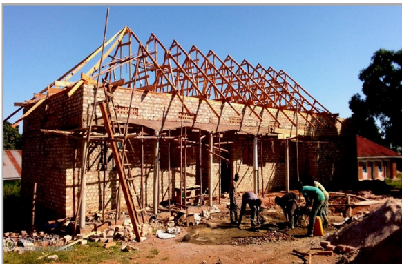
Het gebouw in aanbouw

Voor meer informatie over Wilde Ganzen: www.wildeganzen.nl Bankrek. NL53INGB000 00 40 000 o/vv 2019.0025