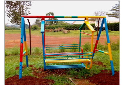
Een van de nieuwe speeltoestellen