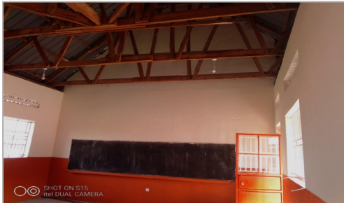
Een van de nieuwe lokalen