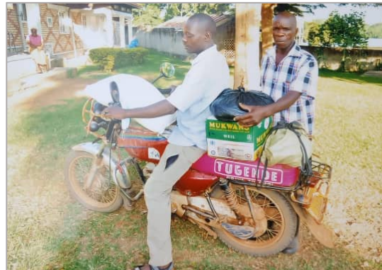
De spullen werden per 'boda boda' naar de families gebracht.