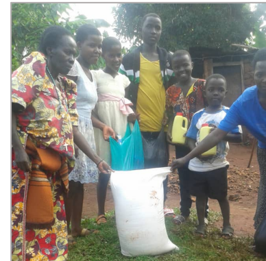
Een van de families die een voedselpakket ontvingen.