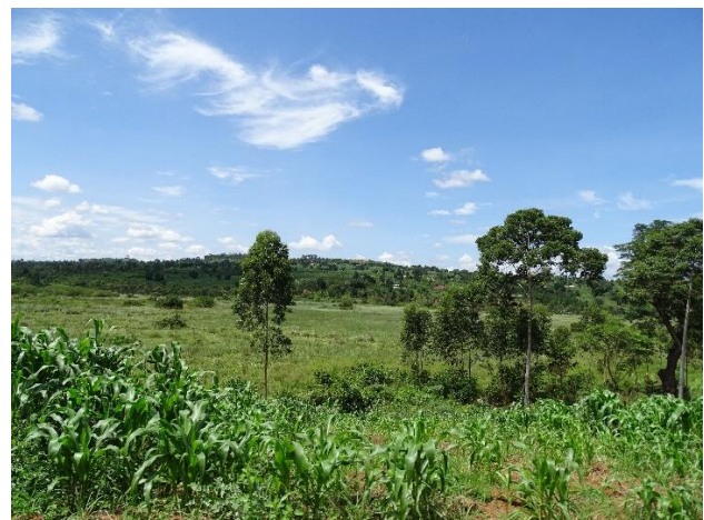
Onderweg in Oeganda