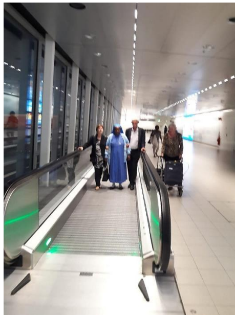
...De 'enge' loopband