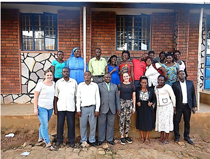
“A great teacher takes a hand, opens a mind and touches a heart”