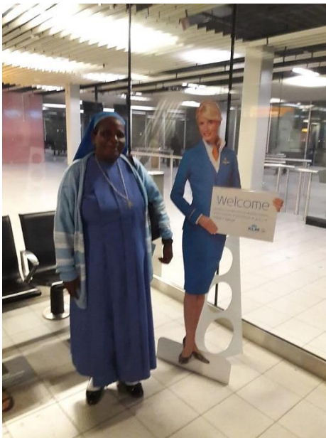
...Bij aankomst op Schiphol

Het samenwerken is in Oeganda veel belangrijker dan de individuele aanpak in Nederland. Schaarse middelen met elkaar delen versus de Nederlandse gedachte om je eigen welvaart te creëren is een ander verschil. Religie speelt nog een grote rol in Oeganda. Sociale rangen en standen zijn daar nog steeds belangrijk. In Nederland doen we aan time-management per uur, in Oeganda per dag. Hier in Nederland plan je weken of maanden vooruit, maar in Oeganda is de horizon veelal maar één dag. Zo kan de opsomming nog even doorgaan en dan blijkt dat er nog steeds een verschil is tussen een derde wereldland als Oeganda en Nederland, als toonbeeld van de “eerste” wereld.