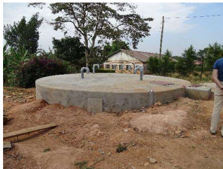
Het ondergrondse waterreservoir