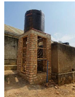
De pomp om het water vanuit het reservoir op te pompen