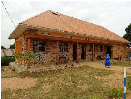
Het gerealiseerde gebouw voor extra lokalen.